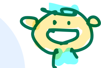
ア・ソ・カ・ウ・ニ・シク 東京 荒井 正規 zlw