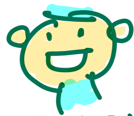
東京都生活文化スポーツ局長 横山 亜樹 zlw