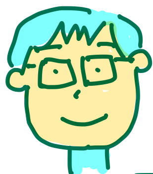
ア・ソ・カ・ウ・ニ・シク 東京 森岡 亜希博 zlw