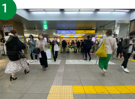
1 西口改札の一番右が広い改札です。