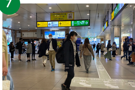
7 そのまま「恵比寿ガーデンプレイス」方面に進みます。