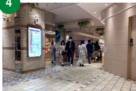
4 エレベーターを降りたら、右の壁に沿って、西館連絡通路へ進みます。