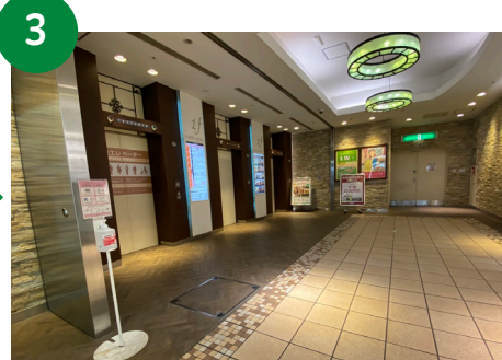
3 左側のエレベーターで3階へ上がります。優先エレベーターは入口側にあります。