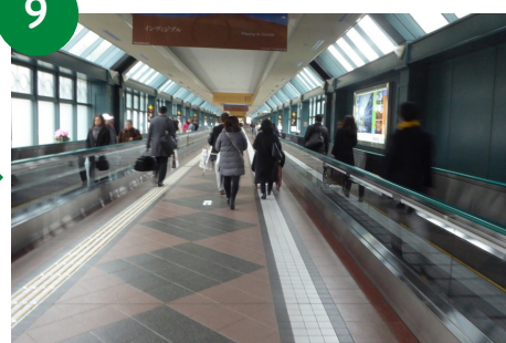
9 動く歩道がありますが、狭いため、真ん中の通路を利用することを推奨します。