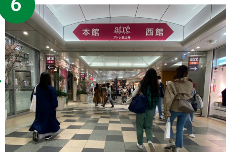
6 通路をまっすぐ進むと、サイン「←本館、西館→」が見えますが、そのまま道なりに進みます。さらに進むと、右手にJRの東口改札が見えます。